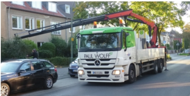
Vrachtwagen bij uitladen

De locatie waar de betonnen ombouw moet komen zal bereikbaar moeten zijn met onze vrachtauto en kraan. Hou rekening met de straat, doorrijhoogte en hoe dichtbij de vrachtwagen bij de plaatsingsplek kan komen.